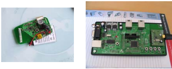
1. Ábra. A mobil egység és bázis állomás

ultrahangot és rádiós hullámokat használ a pozíció meghatározására.